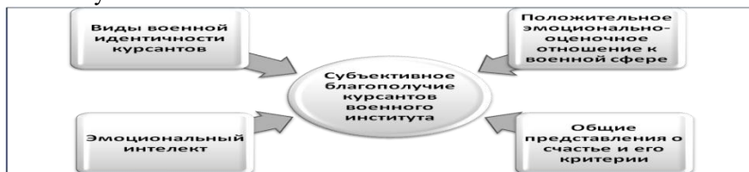
Рис.2. Теоретическая модель субъективного благополучия курсантов.

Детерминация переживания субъективного благополучия курсантов, исходя из проведённого выше анализа теоретических и эмпирических исследований, объясняется взаимодействием комплекса социально-психологических факторов интегрированных в единую систему, в которой основаниями для его переживания учитывая особенности военно-профессиональной среды, выступают: совокупность представлений о счастье как оценочной системы соответствующей содержанию военно-профессиональной деятельности курсантов; положительное эмоционально-оценочное отношение к военной сфере, элементам повседневной деятельности военного института, удовлетворённость взаимоотношениями с курсантским коллективом и командирами, начальниками; достигнутая военная идентичность как результат отождествления себя с социальной ролью военнослужащего, профессиональная деятельность которых направлена на исполнение обязанностей по защите государства, наполняющая деятельность личности смыслом и способствующая его благополучию; эмоциональный интеллект как совокупность способностей курсантов по распознаванию своих эмоций и эмоций ближнего социального окружения (взвода курсантов), а также навыков по управлению ими, как личностного ресурса в достижении благополучия.