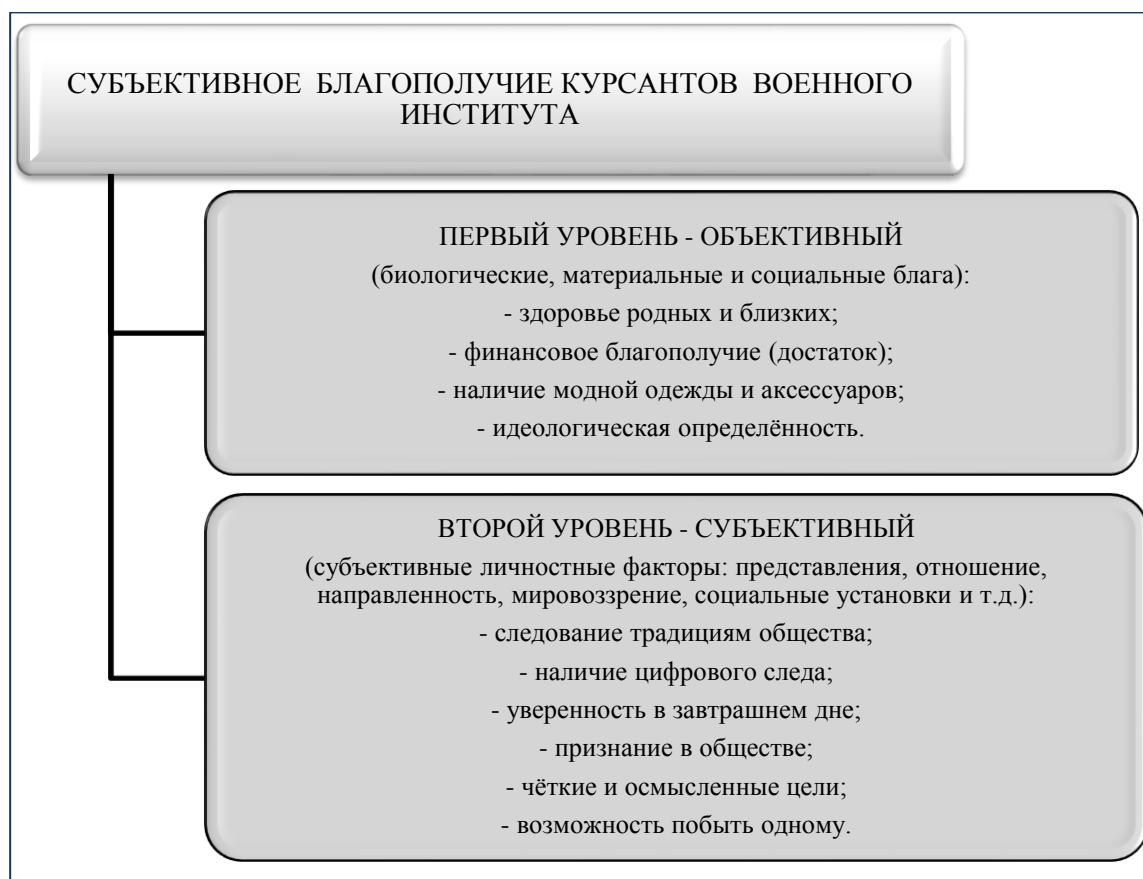
Рис.1. Структурно-уровневая организация субъективного благополучия курсантов.

К моменту поступления в военный институт у кандидатов уже сформирована предварительная военная идентичность, основанная, прежде всего на их желании быть военнослужащим, офицером, а также на социальных представлениях связанных с профессией военнослужащего, которые выражаются в содержательных характеристиках, указывающих на принятие ценностей военной службы.