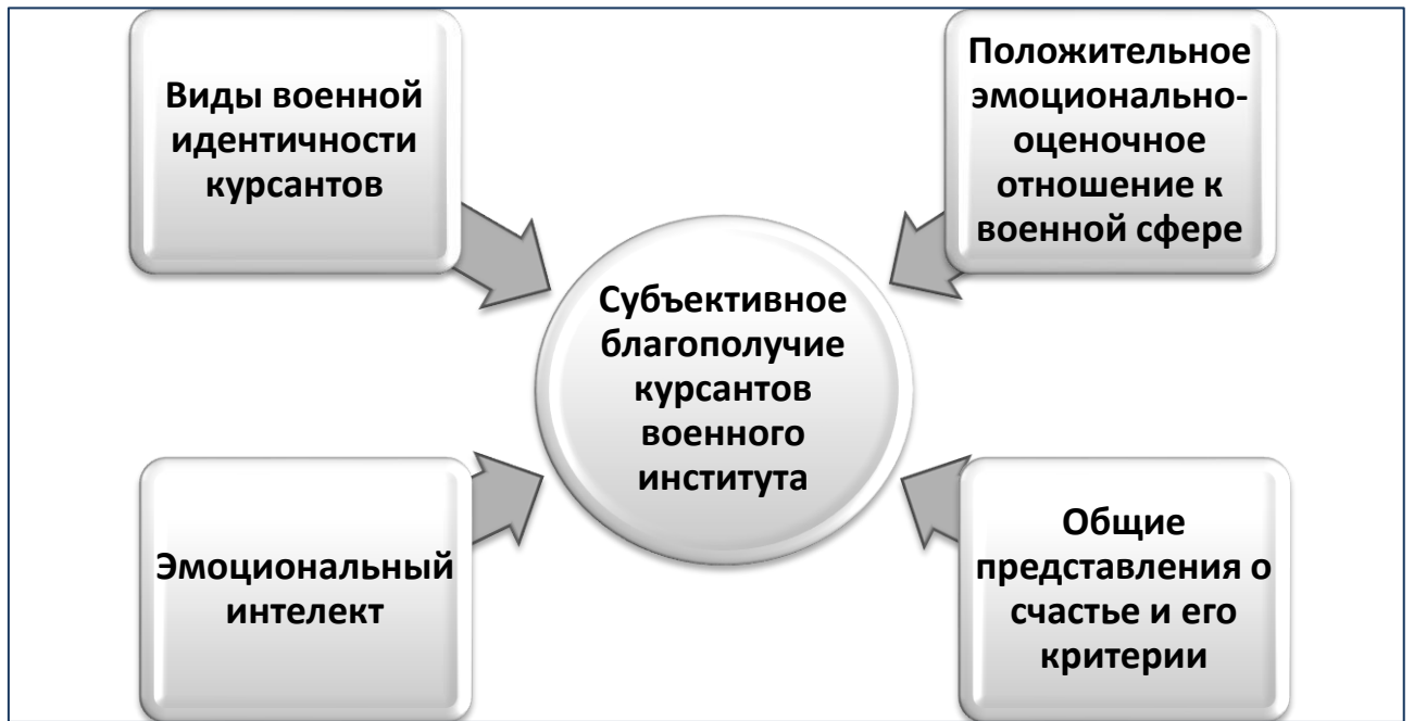
Рис.2. Теоретическая модель субъективного благополучия курсантов.