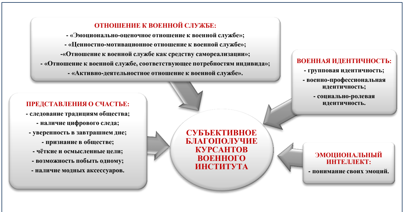
Рис.5. – Система социально-психологических детерминант субъективного благополучия курсантов.

Анализируя результаты эмпирического исследования роли представлений о счастье, отношения к службе и военной идентичности в переживании субъективного благополучия курсантами, можно констатировать сложную, интегральную природу механизма детерминации данного социально-психологического феномена представленную на рисунке 5.